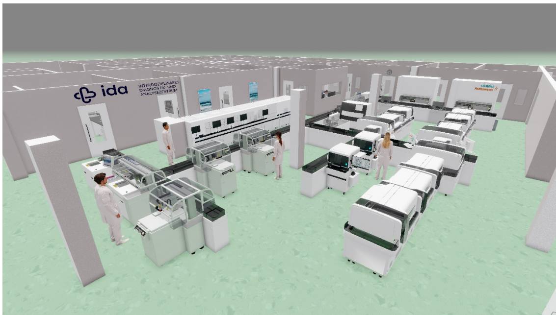
Bildunterschrift 2: 3D-Rendering des neuen interdisziplinären Diagnostik- und Analysezentrums (IDA)

Das Richtfest des IDA markiert einen wichtigen Meilenstein auf dem Weg zur geplanten Inbetriebnahme und dem Start des Regelbetriebs im dritten Quartal 2025. Das Projekt demonstriert eindrucksvoll, wie durch Zusammenarbeit und innovative Ansätze die medizinische Versorgung auf ein neues Niveau gehoben werden kann.