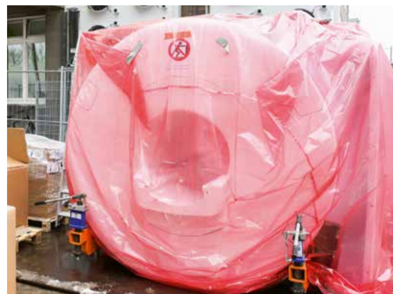
▲ Das neue 3-Tesla-MRT, hier bei der Anlieferung, stellt eine große technische Verbesserung dar. Die moderne Anlage bietet bei Untersuchungen mehr Komfort.