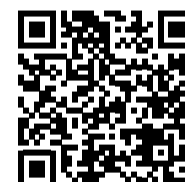
▲ Mehr zum Bauprojekt des 3-Tesla-MRT auf Youtube: Modulanzlieferung.