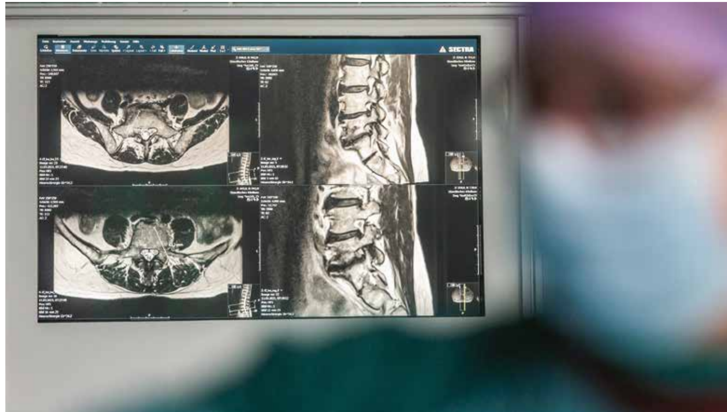
▲ Mit Aufnahmen der Wirbelsäule wird kontrolliert, ob Implantate optimal platziert sind.

dem Eingriff ab, wie es nach der OP weitergeht – ob eine Entlassung nach Hause möglich ist, ob sich ein Aufenthalt in der Kurzzeitpflege, eine Anschlussheilbehandlung oder eine RehaMaßnahme empfiehlt.